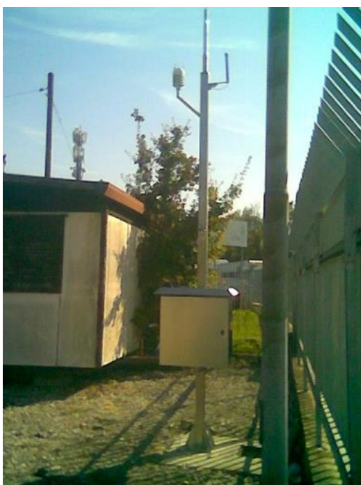
Figura 4 - Postazione P6 - Silfi

Il sistema di monitoraggio correla gli eventi sulla base delle informazioni fornite dal tracciato radar del volo; in assenza di tracciato radar si fa riferimento allo schedato dei voli fornito da AdF. In mancanza di associazione del tracciato radar al dato di pista l'associazione viene fatta in automatico in testata 23 per i decolli e in testata 05 per gli atterraggi.