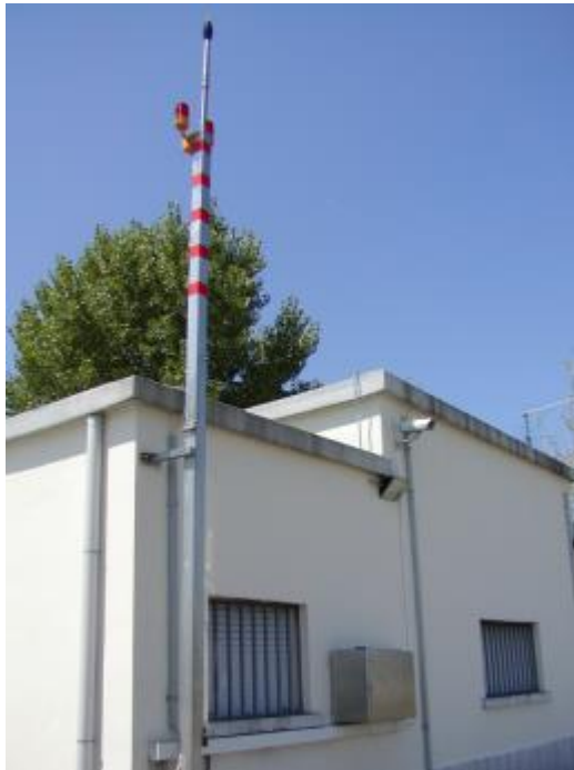
Figura 1 - Postazione P1 – Gonio

Di seguito sono presentate le singole postazioni mediante documenti fotografici che illustrano i siti originali prescelti per il posizionamento e la successiva installazione delle centraline.