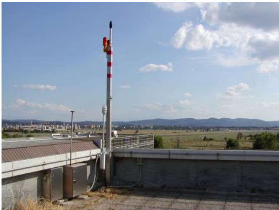
Figura 2 - Postazione P3 - Poste