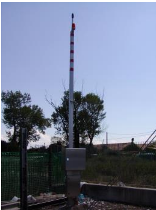
Figura 3 - Postazione P4 - Alcatel